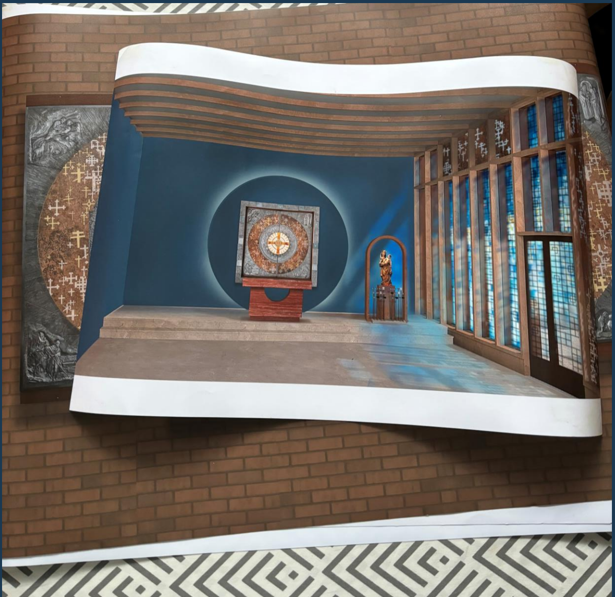
St:a Maria Katolska Kapell Kristianstad